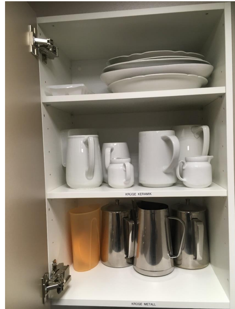
Abbildung 23: Krüge und Servierplatten