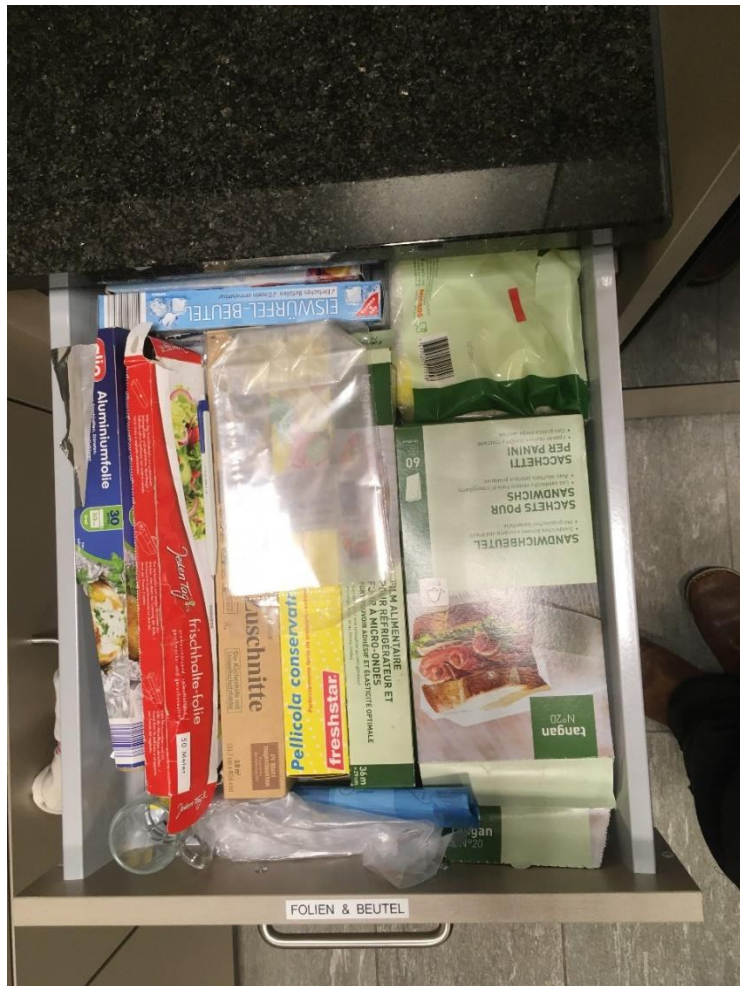
Abbildung 24: Allzweckbeutel, Frischhaltefolie, etc. (wird nicht aufgefüllt)