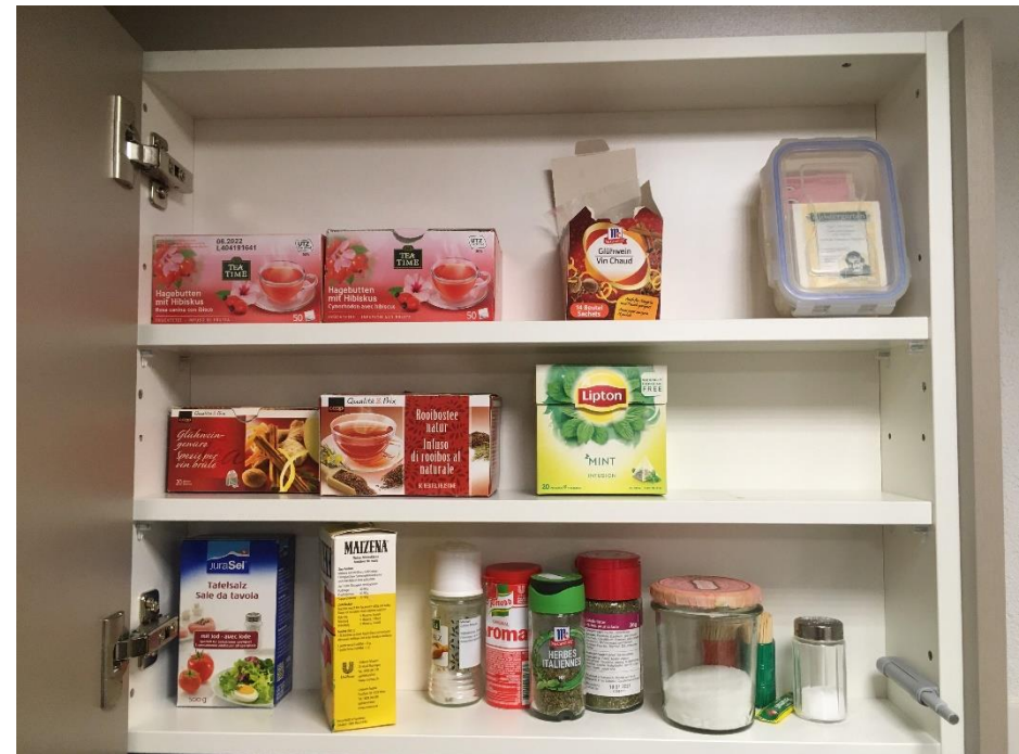
Abbildung 17: Gewürz- & Teeschrank (wird nicht nachgefüllt!)