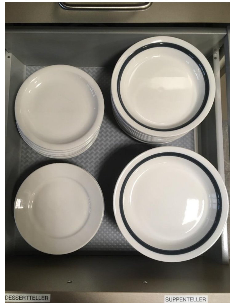
Abbildung 5: Tellerschublade 1