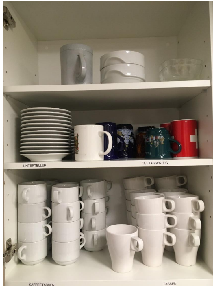
Abbildung 2: Diverse Tassen