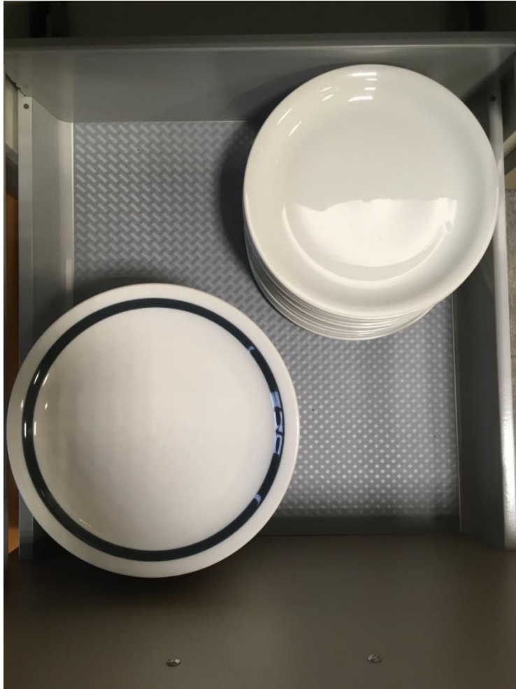
Abbildung 6: Tellerschublade 2