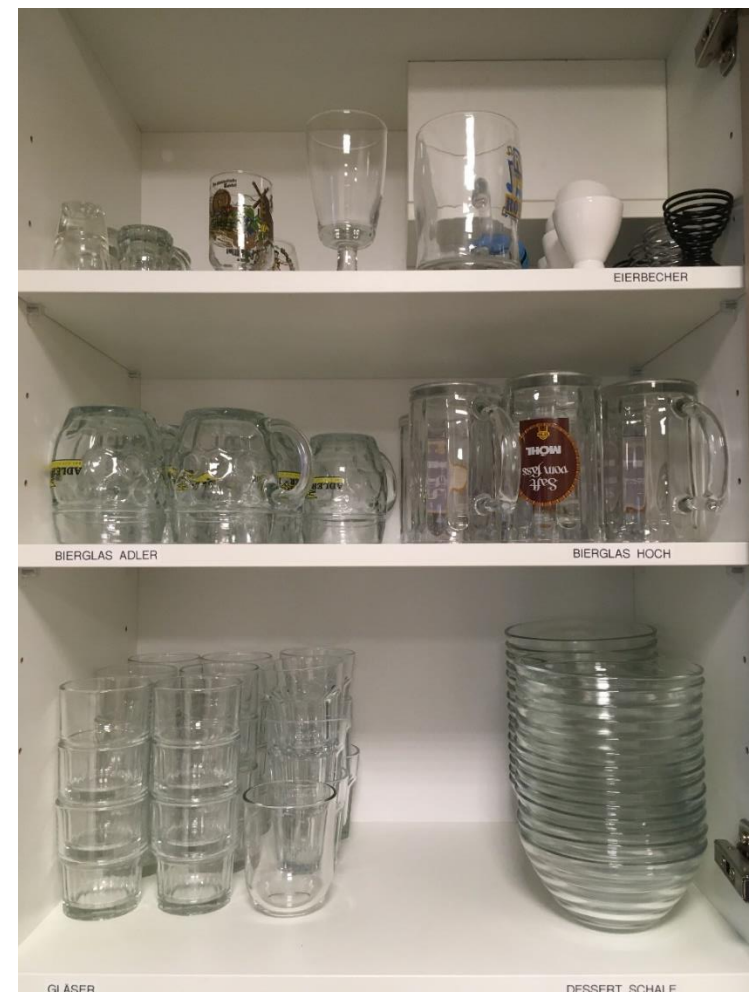
Abbildung 3: Diverse Gläser