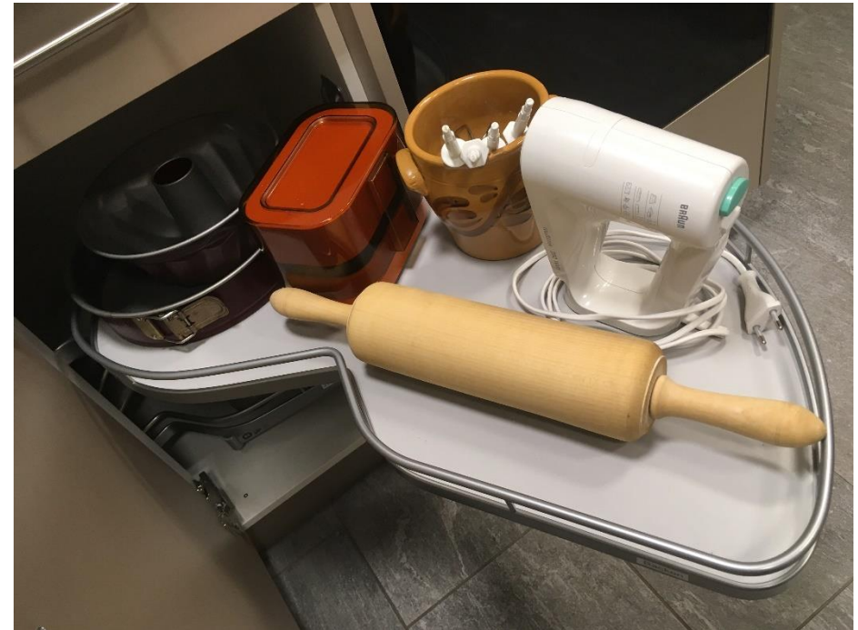
Abbildung 25: Backzubehör