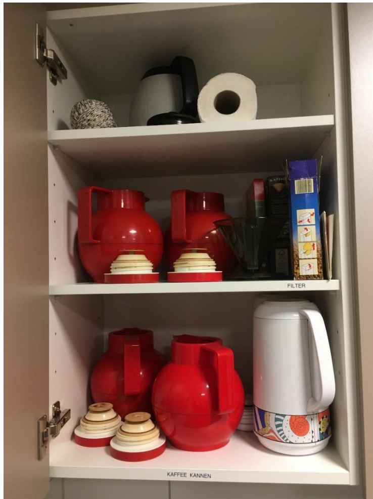
Abbildung 22: Kaffeekrüge und -zubehör