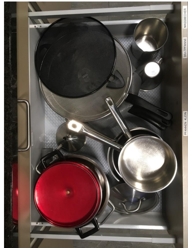
Abbildung 11: Pfannen Teil 1