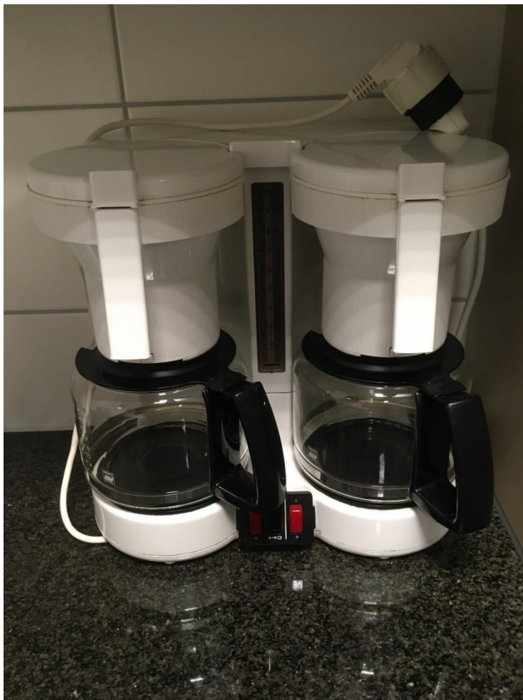
Abbildung 29: Kaffeemaschine (Filter)