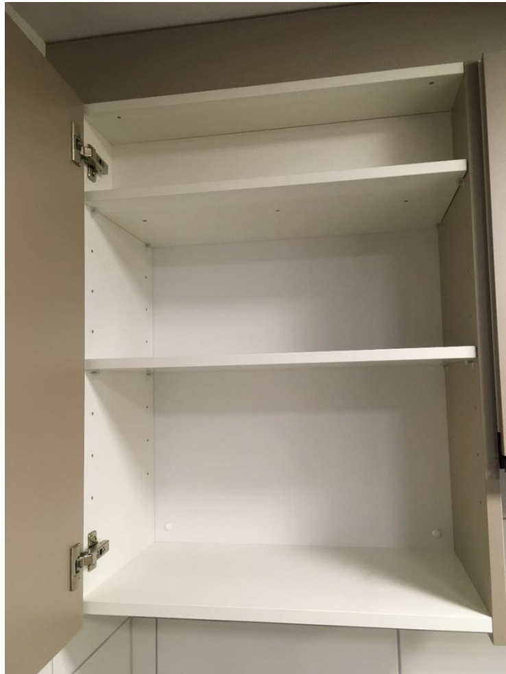
Abbildung 16: Vorratsschrank