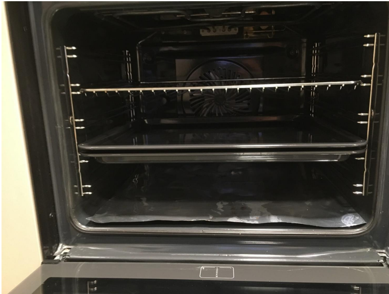
Abbildung 18: Backofen