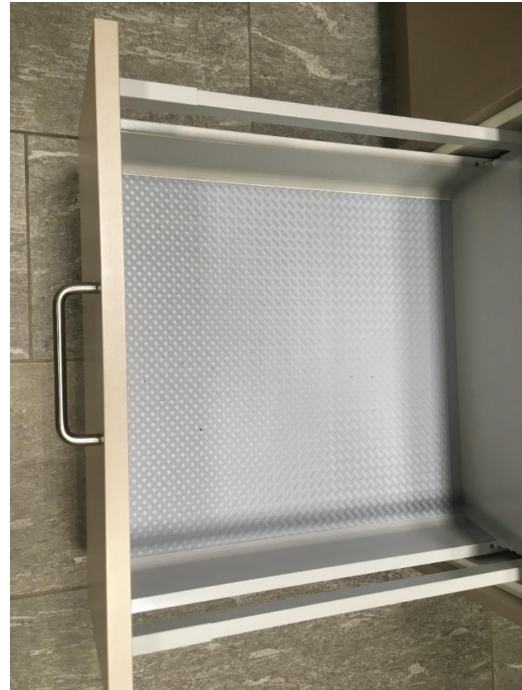
Abbildung 28: Vorratsschaublade (leer)