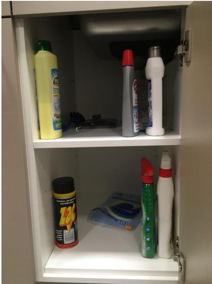
Abbildung 20: Küchen-, Backofenreiniger & Geschirrspülmaschinenmittel