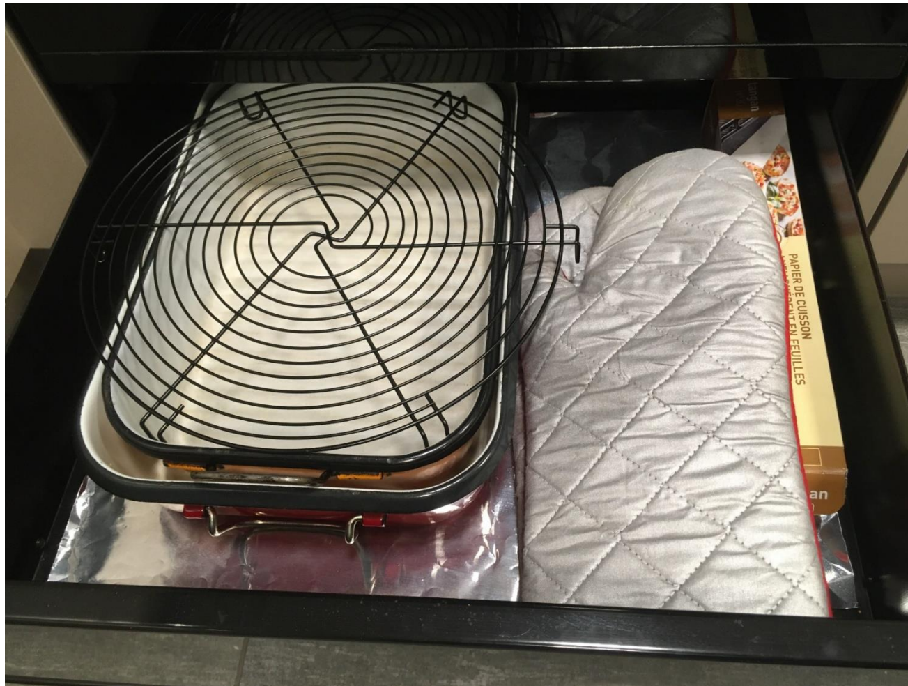
Abbildung 19: Backfenschublade mit Backzubehör