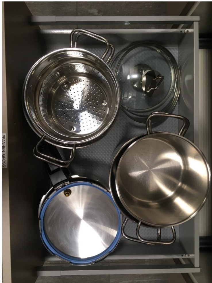
Abbildung 12: Pfannen Teil 2