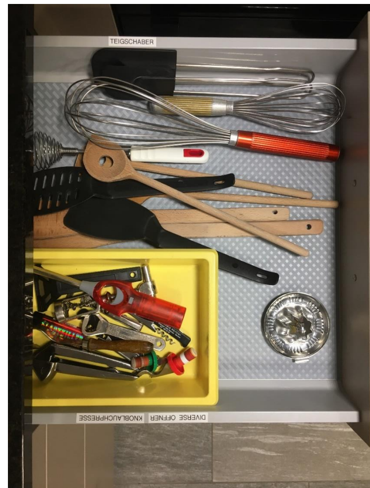
Abbildung 13: Kellen, Schwingbesen, Flaschenöffner, etc.