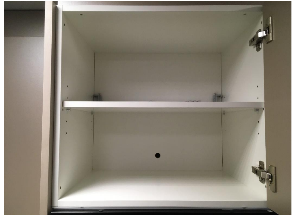
Abbildung 27: Vorratsschrank (leer)