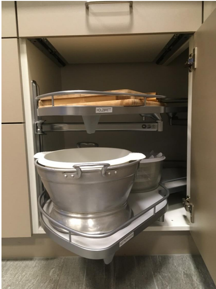
Abbildung 14: Salatschüsseln, Bretter