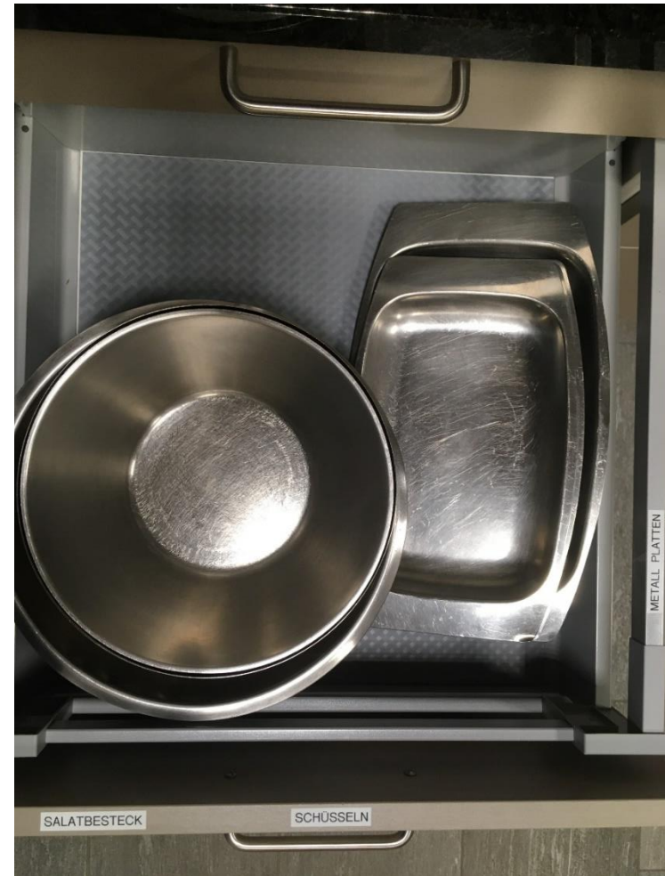
Abbildung 9: Chromstahl Schüsseln & Schalen