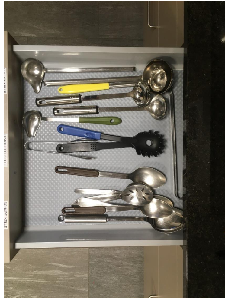
Abbildung 7: Diverse Kellen