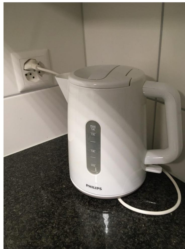
Abbildung 30: Wasserkocher