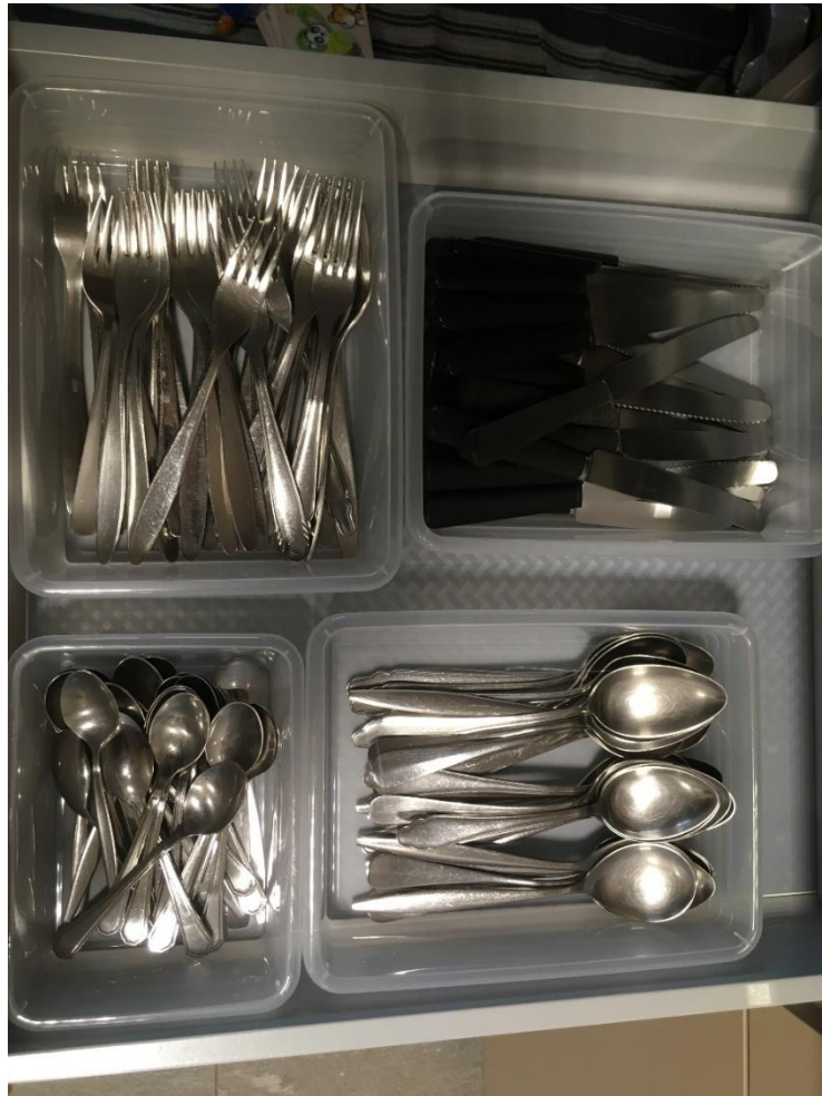
Abbildung 4: Besteck