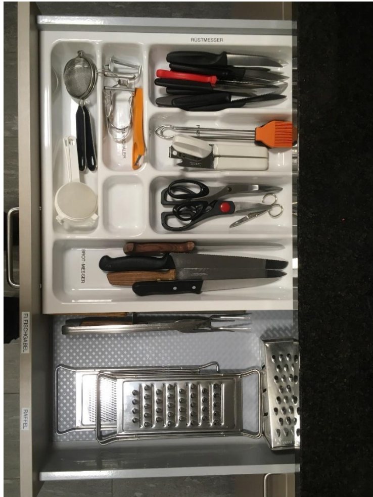
Abbildung 10: Messer, Raffeln, Scherren, etc.