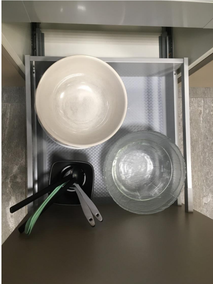
Abbildung 8: Schüsseln, Salatbesteck