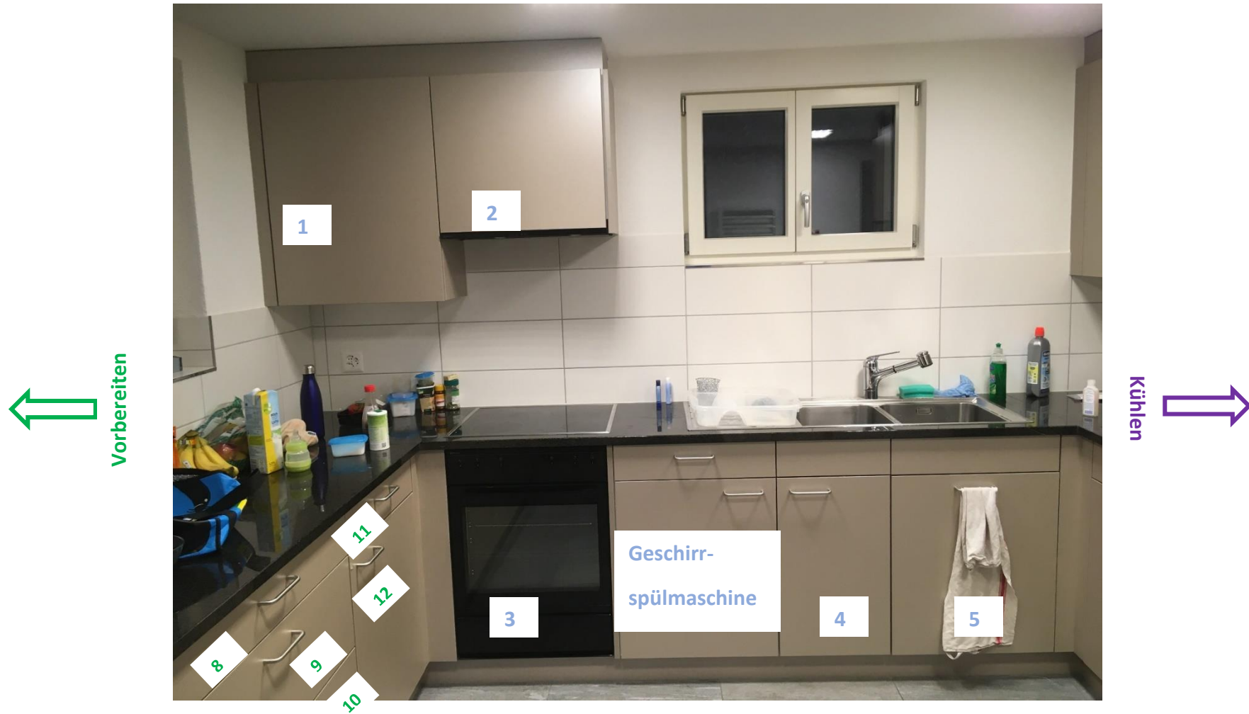
Abbildung 15: Übersicht Kochen