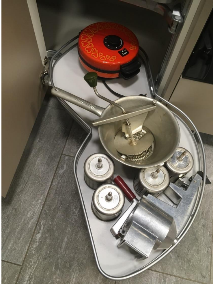
Abbildung 26: Div. Küchenutensilien